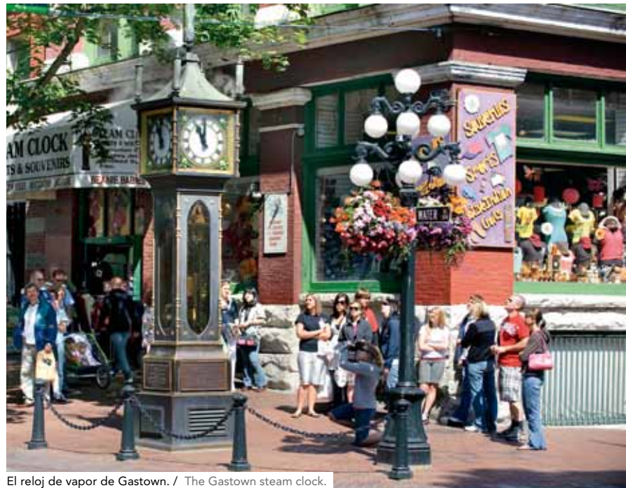
El reloj de vapor de Gastown. / The Gastown steam clock.

Una de las cosas que más se le reconoce a Vancouver es su hermosa yuxtaposición de arquitectura urbana moderna y una naturaleza salvaje y monumental, que bien puede ser la causa de que la industria del turismo ocupe el segundo lugar en su economía. Y en los últimos diez años, los principales estudios cinematográficos instalados en Vancouver y en las zonas metropolitanas circundantes le han atribuido el apodo de la "Hollywood del Norte" (basta recordar la saga de Crepúsculo ). »