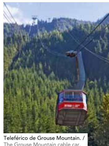
Teleférico de Grouse Mountain. / The Grouse Mountain cable car.