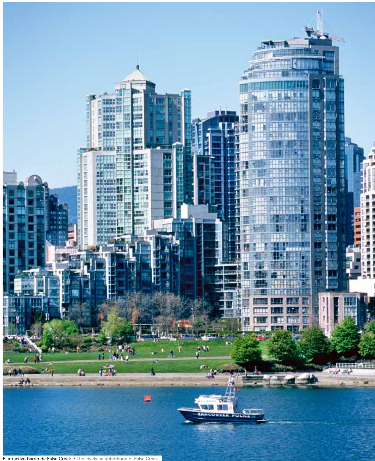
El atractivo barrio de False Creek. / The lovely neighborhood of False Creek.