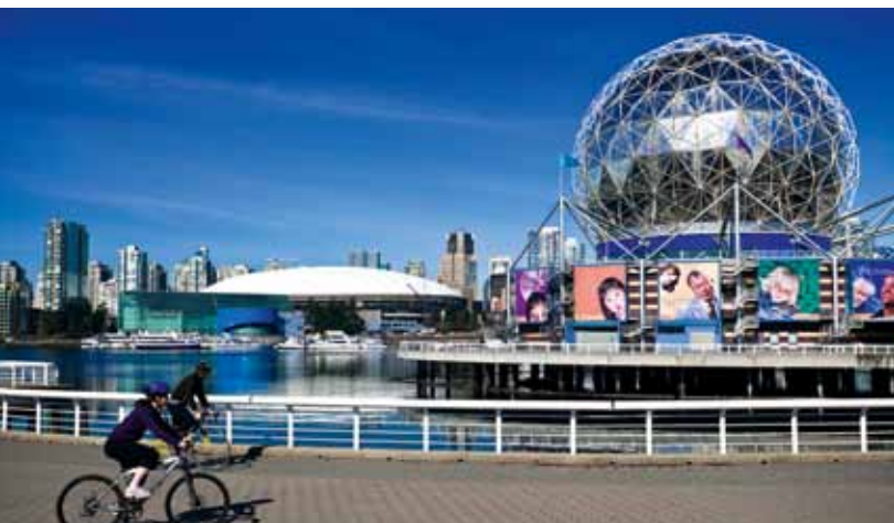
BC Place Stadium y Science World. / BC Place Stadium and Science World.

But one of the most attractive things about laid-back Vancouver is that the city and its inhabitants seem to radiate health. People are friendly. The city is clean. The sea air smells fresh. »