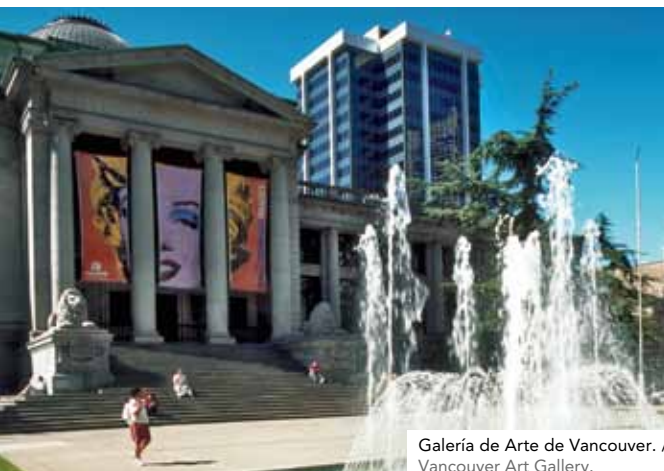
Galería de Arte de Vancouver. / Vancouver Art Gallery.