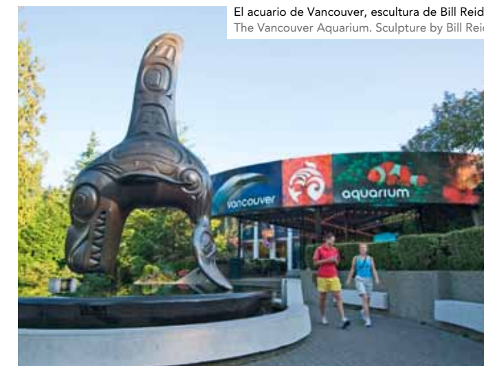
El acuario de Vancouver, escultura de Bill Reid. / The Vancouver Aquarium. Sculpture by Bill Reid.

At the north end of Stanley Park is the Lion's Gate Bridge, leading to North and West Vancouver. Visible from almost anywhere in the city, "North Van's" North Shore Mountains provide a stunning backdrop to the glittering high-rise towers that punctuate the skyline. Vancouver was given a "mini face-lift" to prepare it for hosting the world's greatest athletes in the 2010 Winter Olympics and Winter Paralympics. The shiny new skyscrapers are not unusual for Vancouver, though about every 25 years, the city seems to tear everything down and start all over again. The city's inhabitants joke that the only standard for Vancouver's architecture is that it's always changing. »