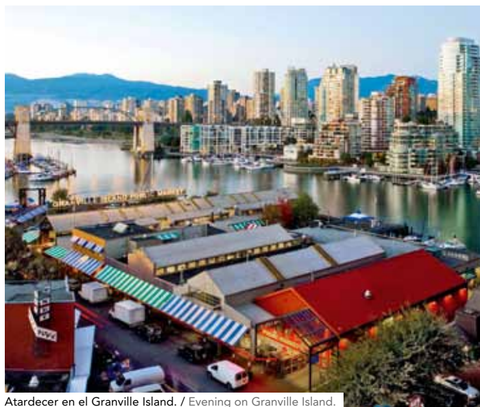
Atardecer en el Granville Island. / Evening on Granville Island.

Otra parada imperdible es el Museo de Antropología de la Universidad de British Columbia, uno de los mejores del orbe. Cuenta en su acervo con 38 mil piezas etnográficas y más de medio millón de objetos arqueológicos, muchos originarios de los pueblos indígenas de la provincia. Es fácil que se nos pase el día al recorrer sus salones y conocer múltiples aspectos de las distintas culturas del mundo. »