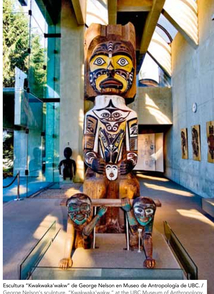
Escultura "Kwakwaka'wakw" de George Nelson en Museo de Antropología de UBC. / George Nelson's sculpture, "Kwakwaka'wakw," at the UBC Museum of Anthropology.