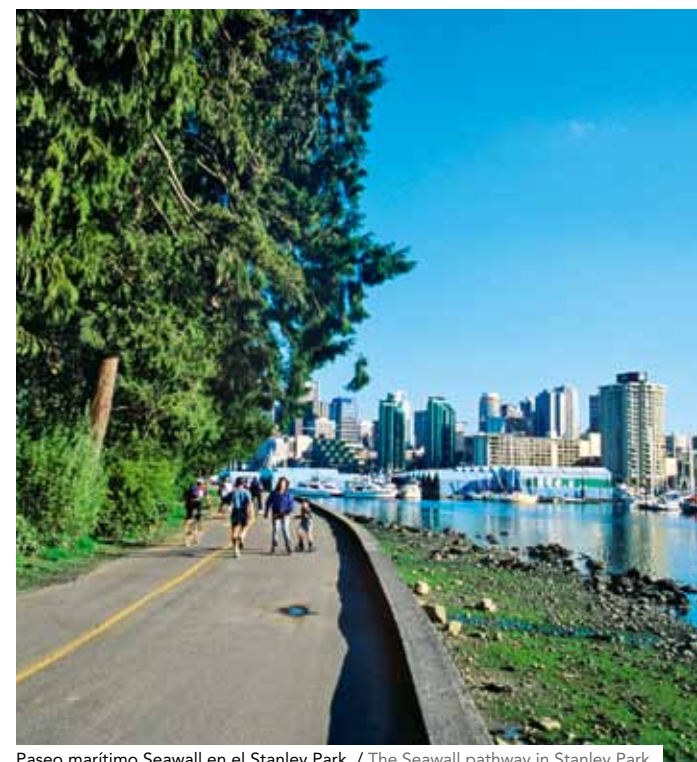
Paseo marítimo Seawall en el Stanley Park. / The Seawall pathway in Stanley Park.